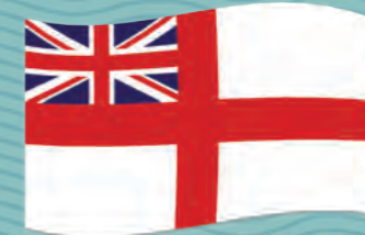
Abbildung: Die Flaggen der 39 Counties von England

Bedfordshire - Berkshire - Buckinghamshire - Cambridgeshire - Cheshire - Cornwall - County Durham - Cumberland - Derbyshire - Devon - Dorset - Essex - Gloucestershire - Hampshire - Herefordshire - Hertfordshire - Huntingdonshire - Kent - Lancashire - Leicestershire - Lincolnshire - Middlesex - Norfolk - Northamptonshire - Northumberland - Nottinghamshire - Oxfordshire - Rutland - Shropshire - Somerset - Staffordshire - Suffolk - Surrey - Sussex - Warwickshire - Westmorland - Wiltshire - Worcestershire - Yorkshire